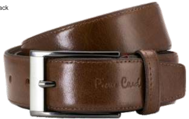
21 mogano / mogano