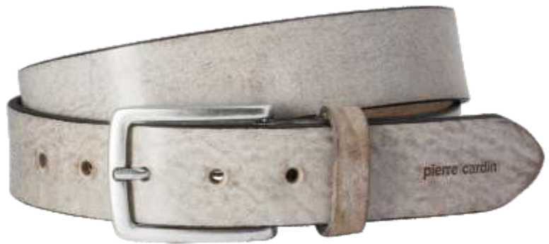
26 taupe / taupe