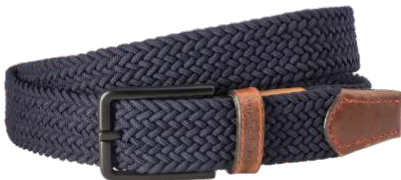
40 marine / navy