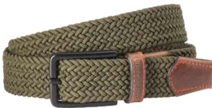
60 oliv / olive