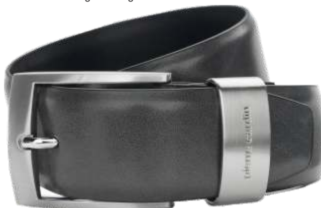
50 grau / grey