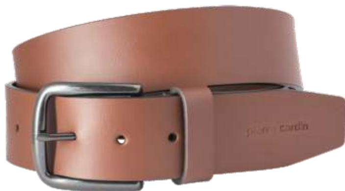
22 cognac / cognac