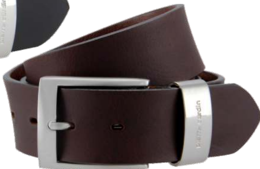
23 dunkelbraun / darkbrown