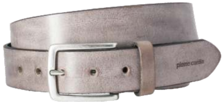
50 grigio / grey