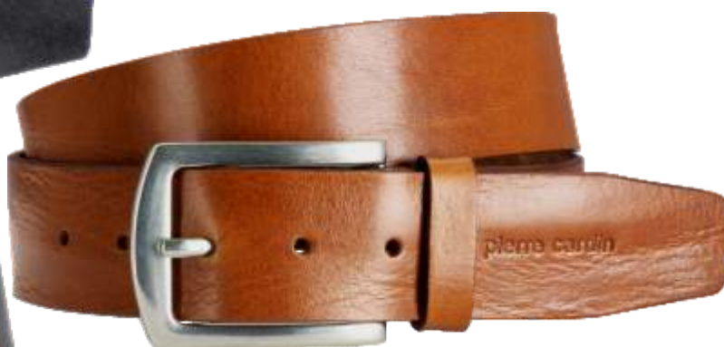
22 cognac / cognac