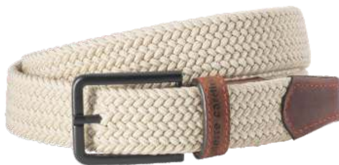
24 beige / beige