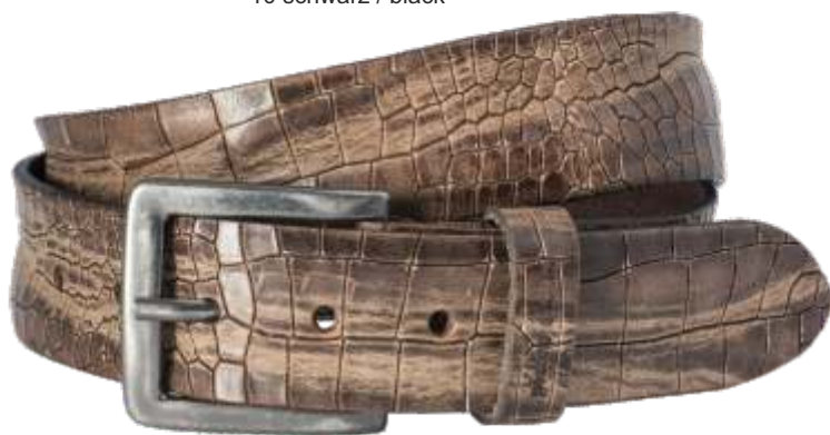
23 dunkelbraun / darkbrown