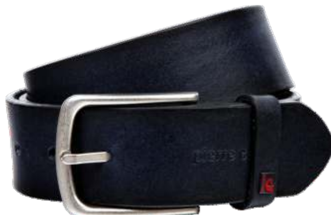
40 marine / navy