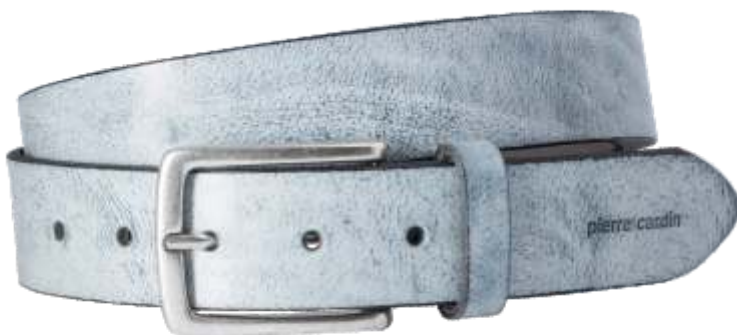
42 jeans / jeans