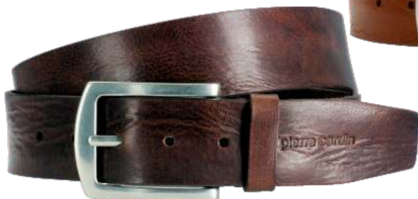
23 dunkelbraun / darkbrown