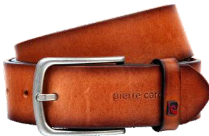
22 cognac / cognac