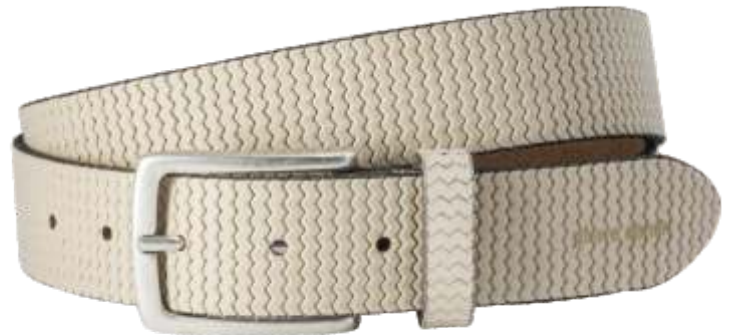
25 ecru / ecru