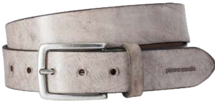
20 braun / brown