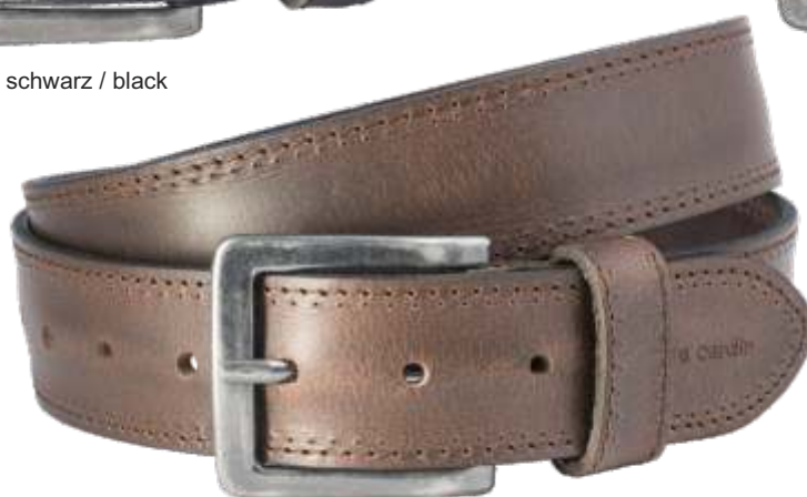
23 dunkelbraun / darkbrown