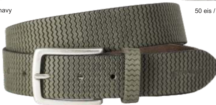
60 grün / green