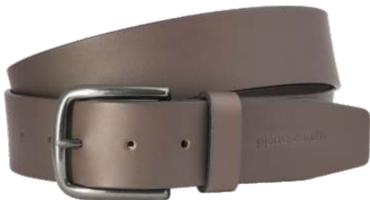
23 dunkelbraun / darkbrown