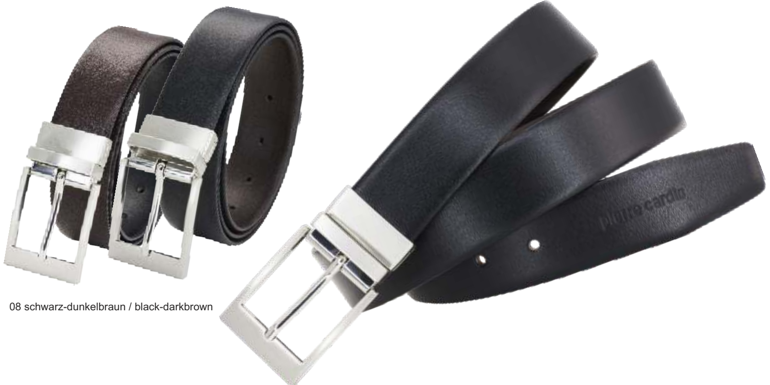
08 schwarz-dunkelbraun / black-darkbrown

Artikelnummer / article number: 1070080 Preiskategorie / price category: PC 11 Bundweiten / waists: 85 - 150 cm Breite / width: 35 mm