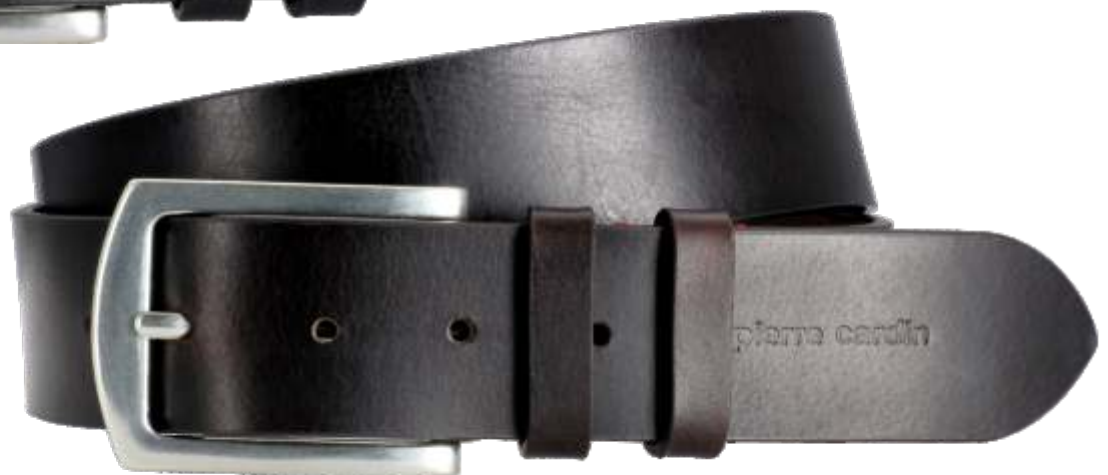
23 dunkelbraun / darkbrown