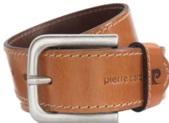
22 cognac / cognac