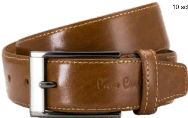
22 cognac / cognac