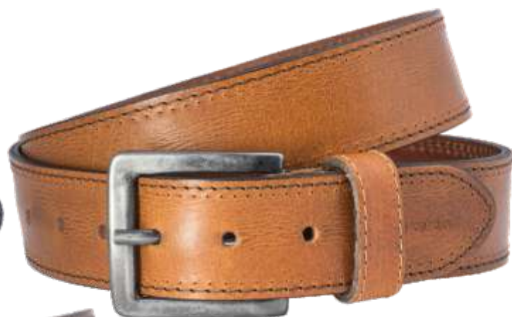
22 cognac / cognac