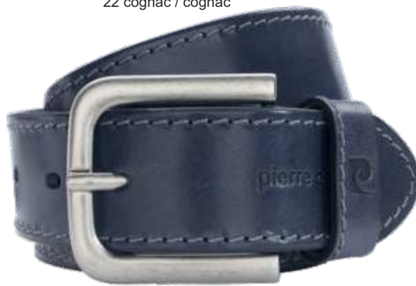
40 marine / navy