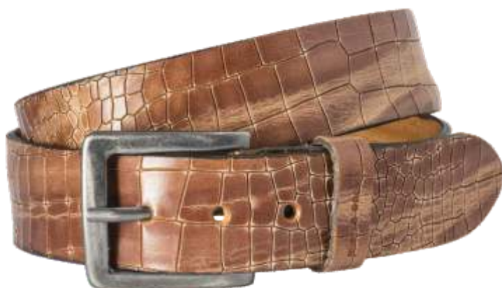
22 cognac / cognac