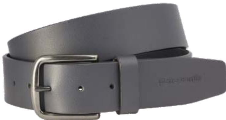
40 marine / navy