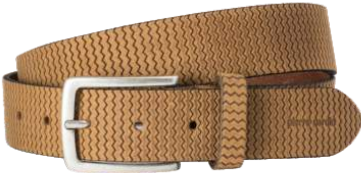
24 camel / camel