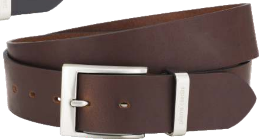
23 dunkelbraun / darkbrown