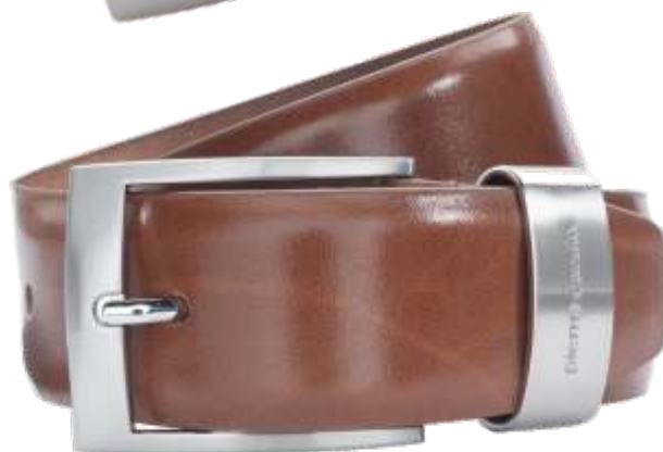
22 cognac / cognac