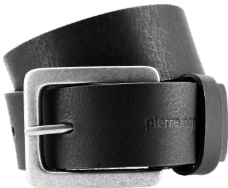
10 schwarz / black