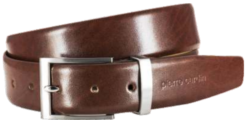
22 cognac / cognac