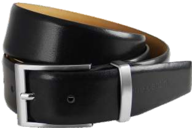
10 schwarz / black