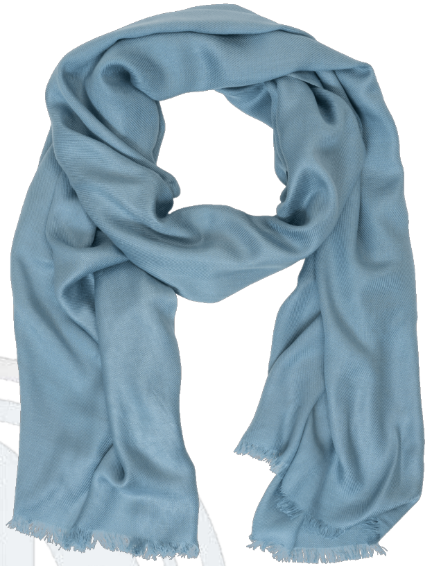
6402536/03 P124 70 cm x 180 cm, 100% Viskose/viscose