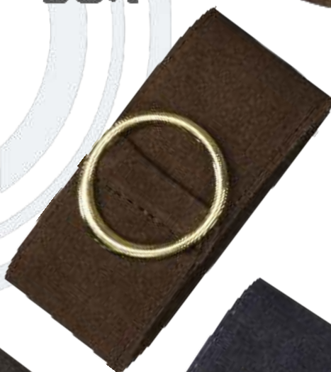
20 braun / brown