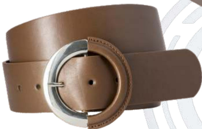
20 braun / brown