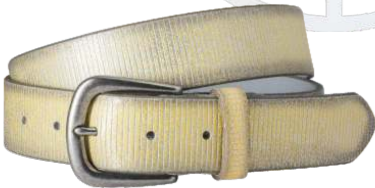
24 beige / beige