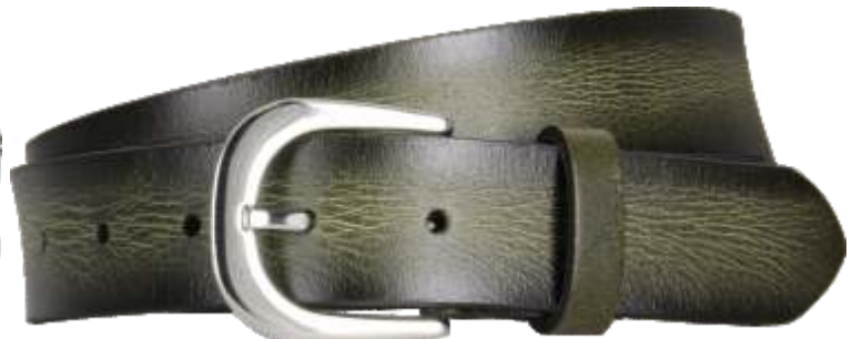
60 grün / green