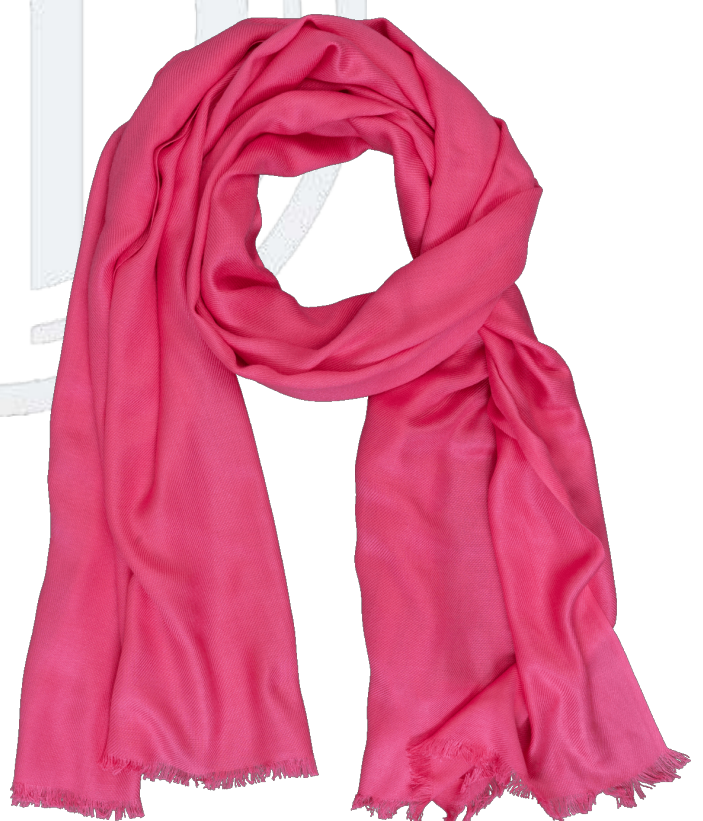
6402536/01 P124 70 cm x 180 cm, 100% Viskose/viscose