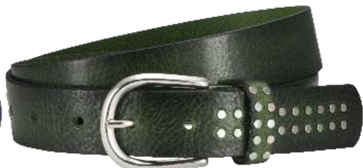
60 grün / green