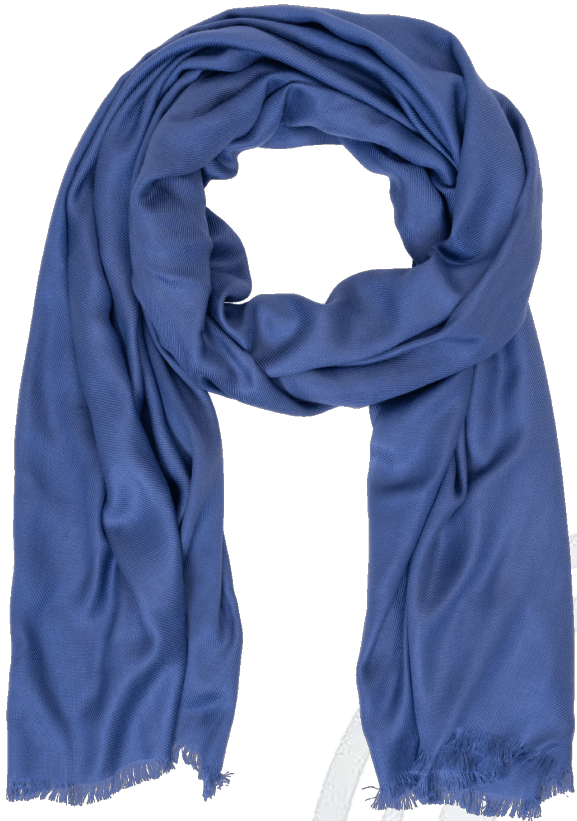
6402536/02 P124 70 cm x 180 cm, 100% Viskose/viscose