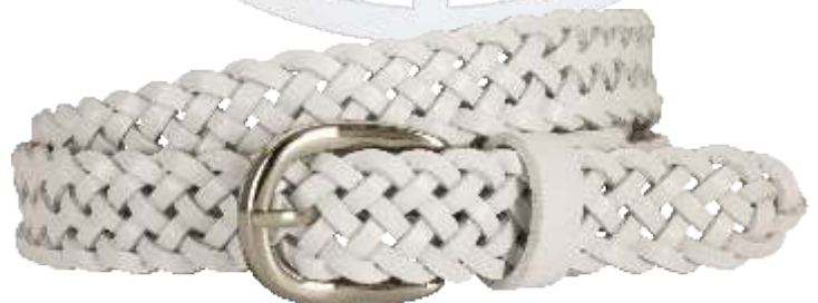
70 weiss / white