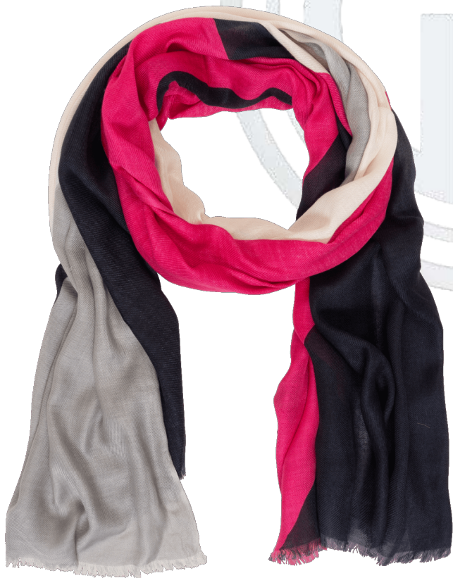
6402518/03 P134 75 cm x 200 cm, 100% Viskose/viscose