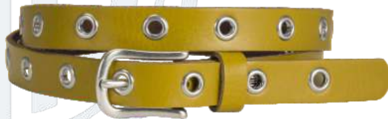
80 gelb / yellow