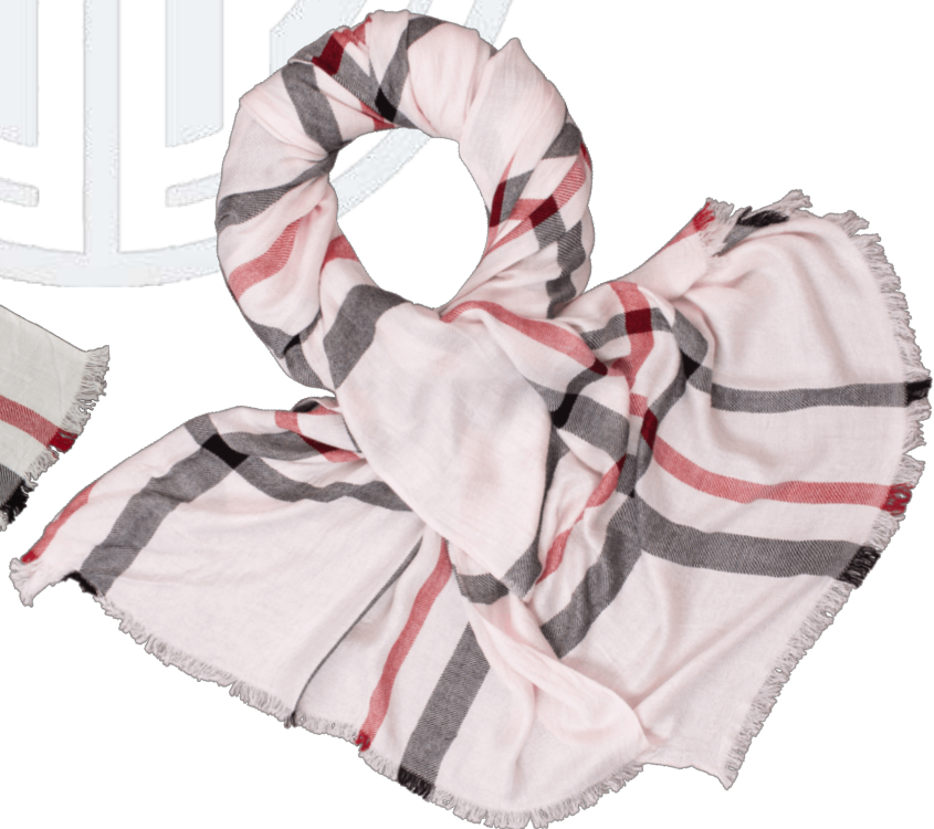
6402500/02 P124 60 cm x 180 cm, 100% Baumwolle/cotton