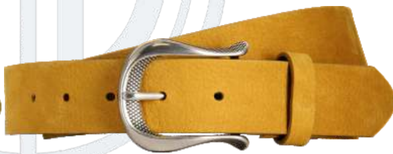
90 gelb / yellow