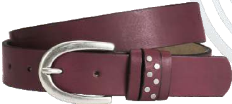
30 rot / red