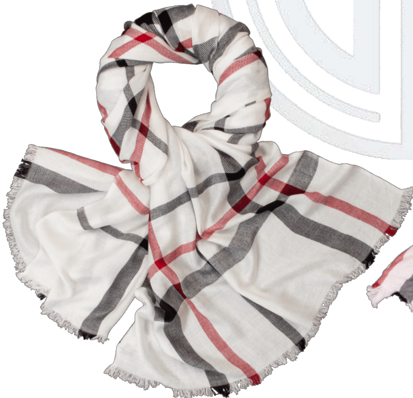
6402500/01 P124 60 cm x 180 cm, 100% Baumwolle/cotton