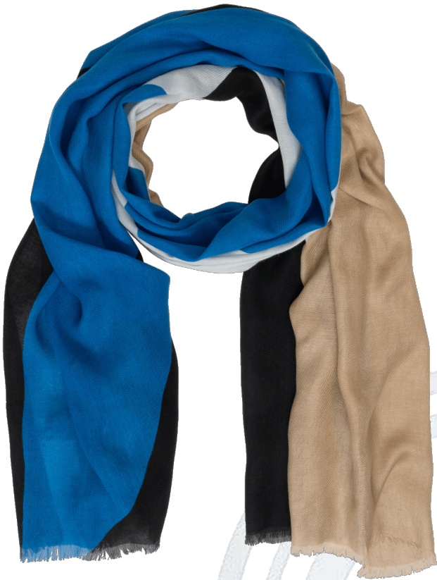
6402518/01 P134 75 cm x 200 cm, 100% Viskose/viscose