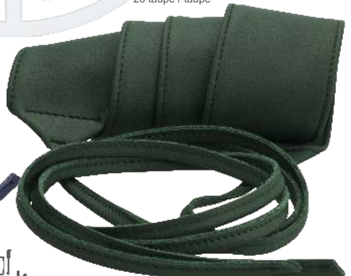
60 grün / green