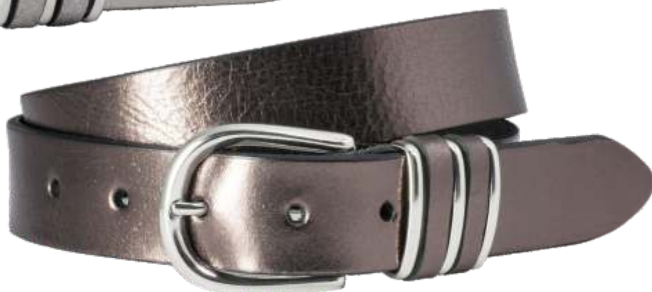
13 gun-metall / gun-metal