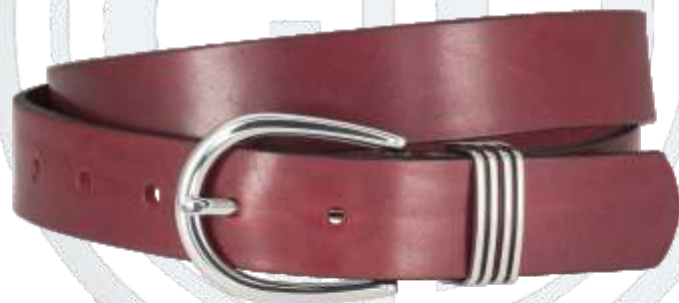
32 bordeaux / burgundy