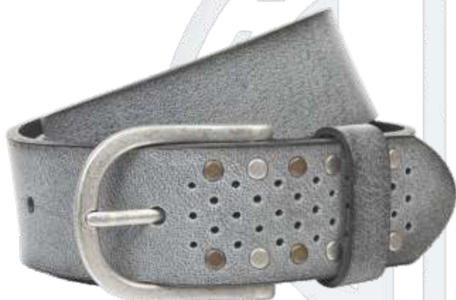
11 anthrazit / anthracite