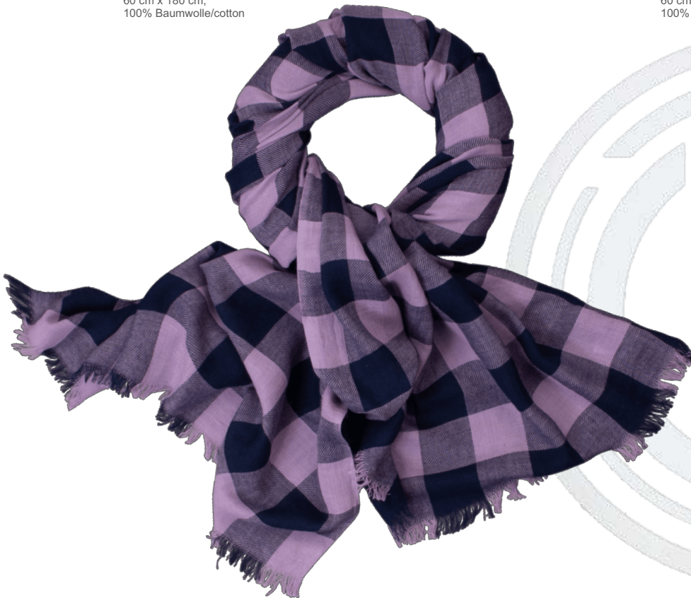
6402539/03 P124 60 cm x 180 cm, 100% Baumwolle/cotton