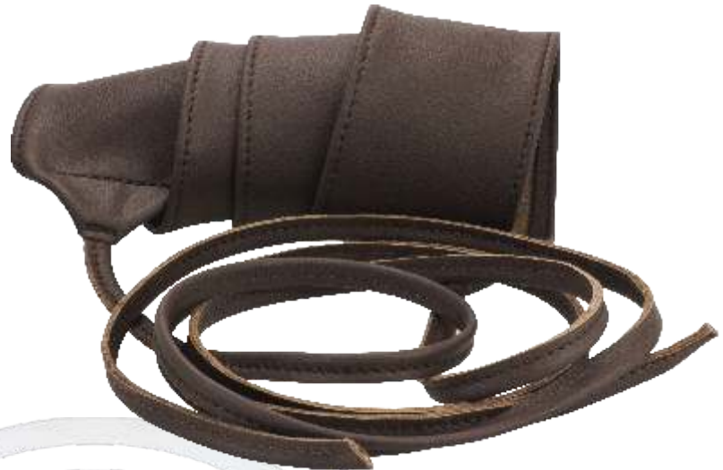
20 braun / brown