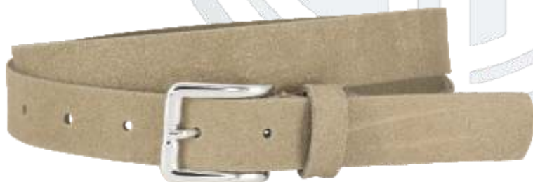
26 taupe / taupe