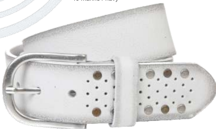
70 weiss / white