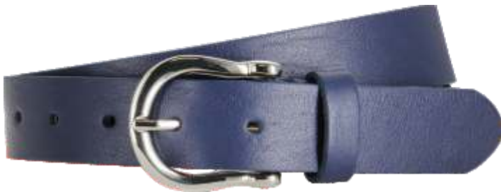
40 marine / navy