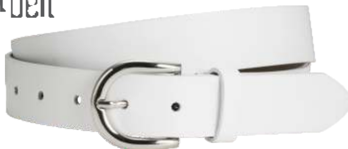
70 weiss / white