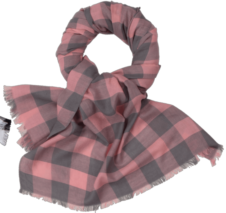
6402539/02 P124 60 cm x 180 cm, 100% Baumwolle/cotton