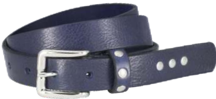
40 marine / navy