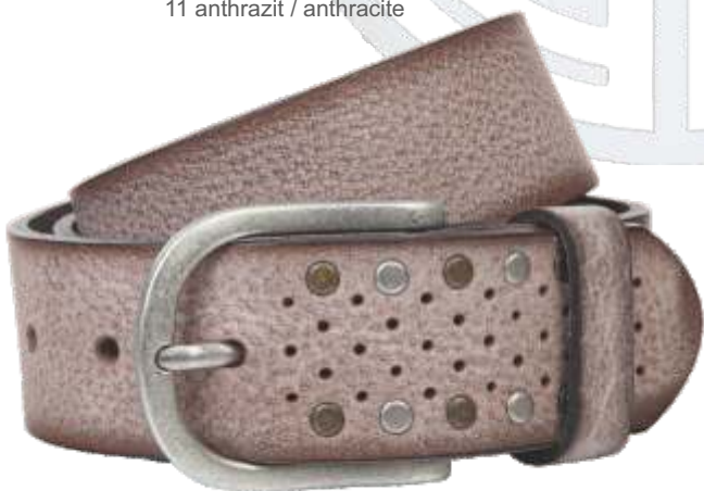
55 kiesel / pebble