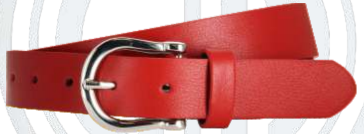
32 rot / red