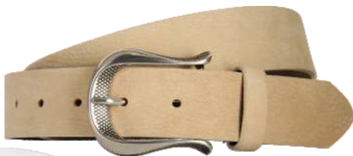
24 beige / beige