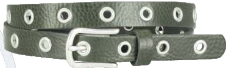
60 dunkelgrün / darkgreen