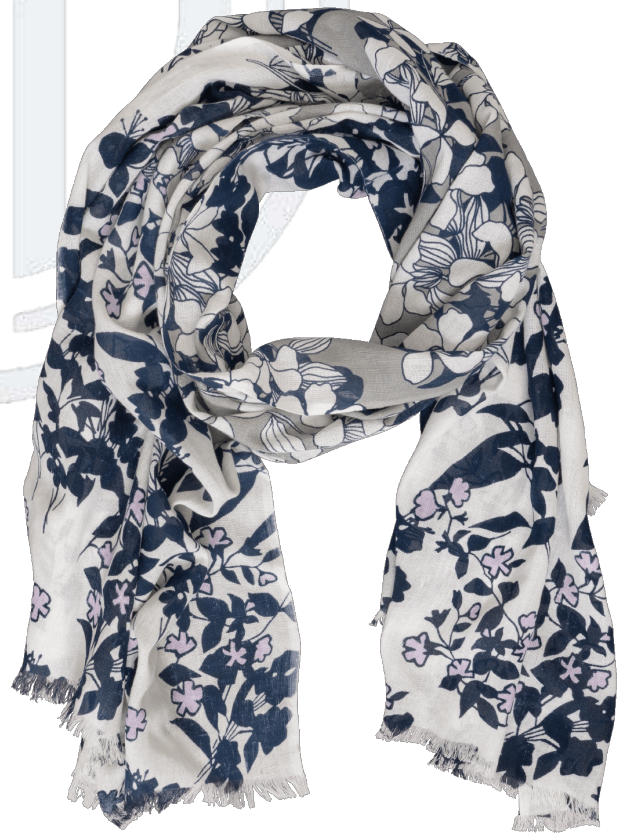
6402513/02 P134 100 cm x 200 cm, 100% Baumwolle/cotton