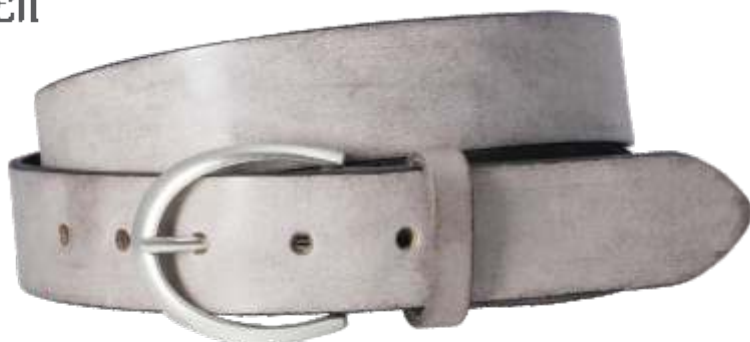
50 grigio / grigio