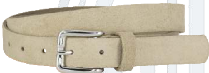
24 ecru / ecru