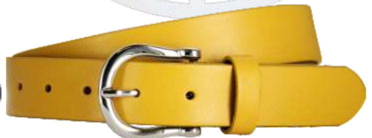
90 gelb / yellow