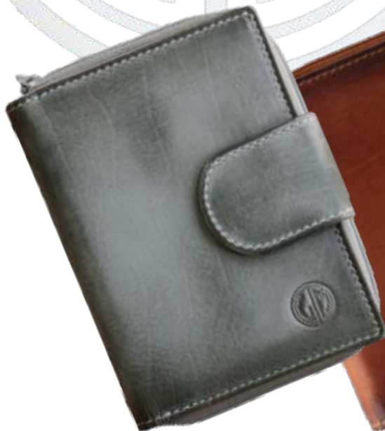
50 grau / grey