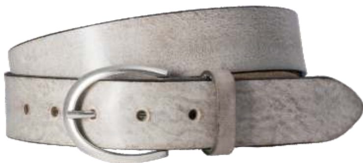
26 taupe / taupe