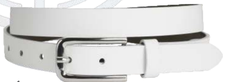
70 weiss / white