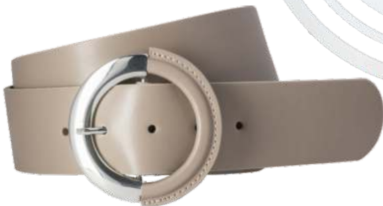
26 taupe / taupe