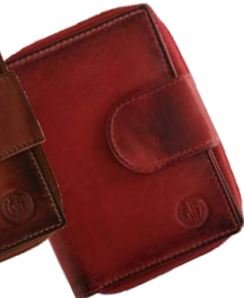
30 rot / red