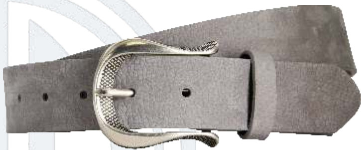
50 grau / grey