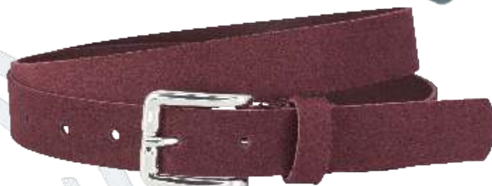
32 bordeaux / burgundy