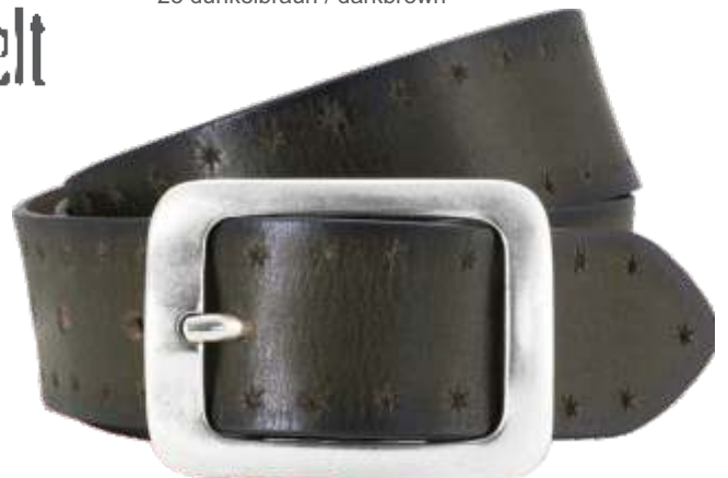
60 olive / olive