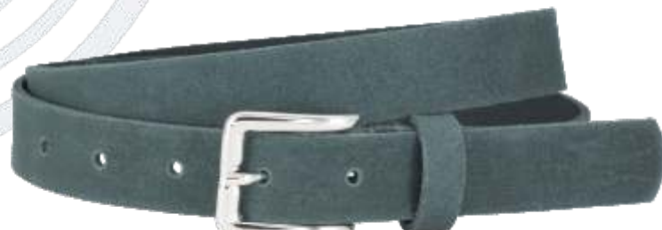
60 dunkelgrün / darkgreen