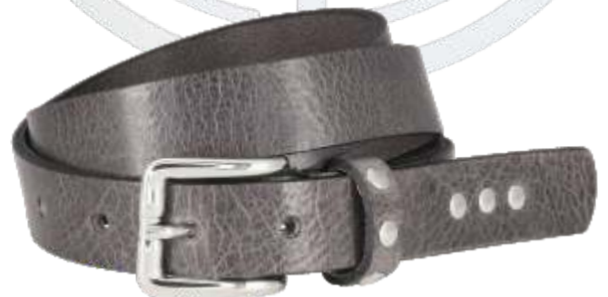
50 grau / grey