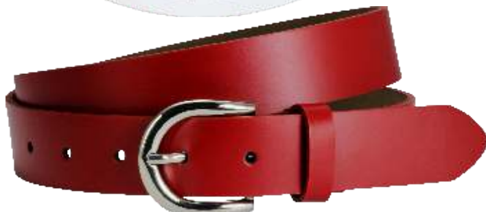
30 rot / red