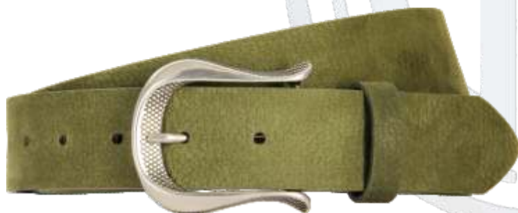
60 grün / green