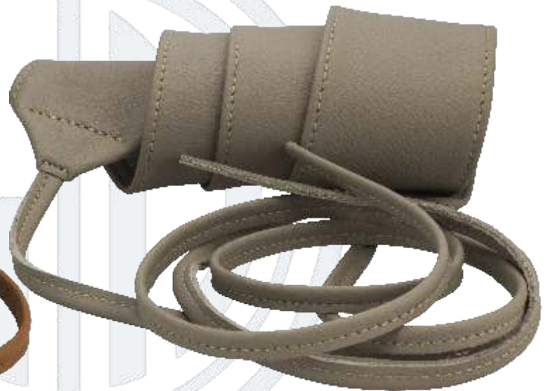
26 taupe / taupe