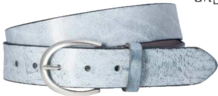
42 jeans / jeans