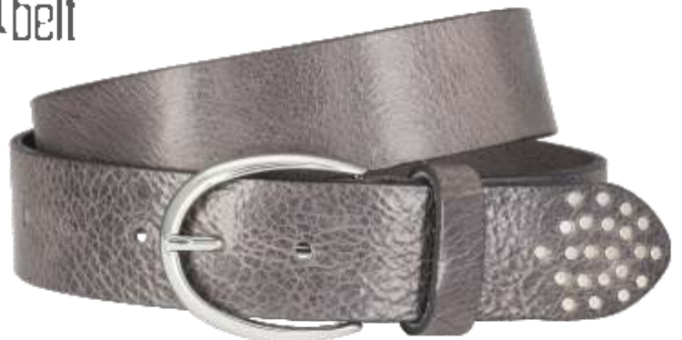
50 grau / grey