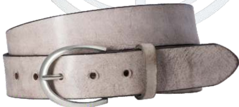
20 braun / brown