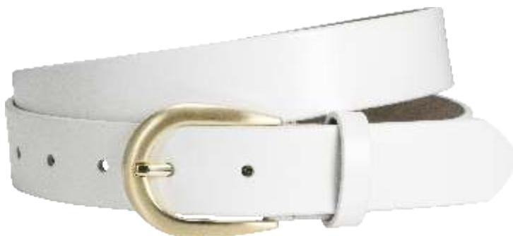
70 weiss / white