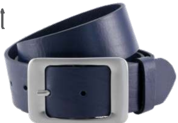
40 marine / navy