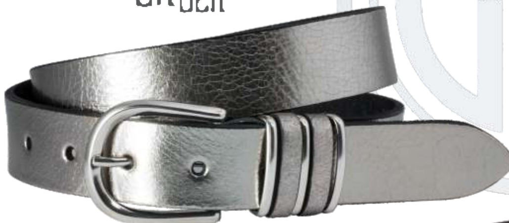
11 silber / silver