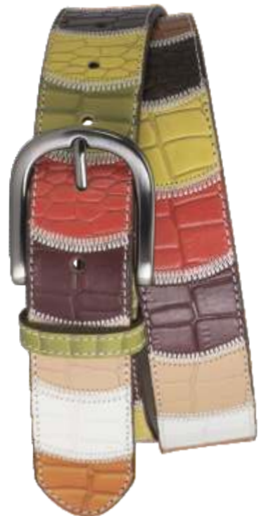
99 multicolor / multicolor