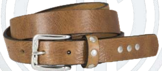
24 beige / beige