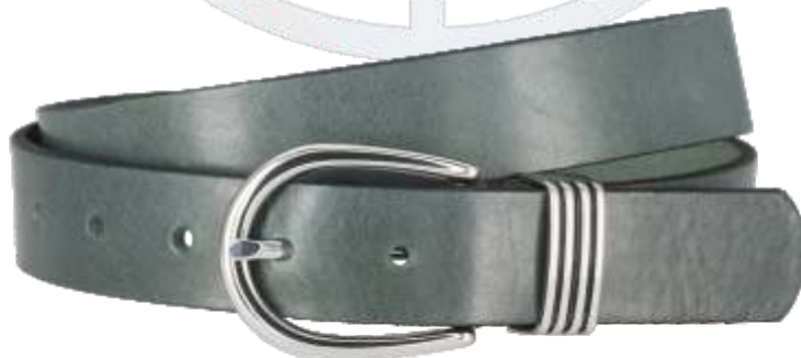
60 dunkelgrün / darkgreen