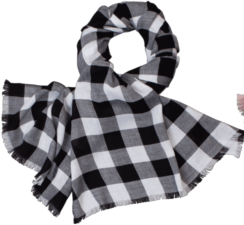
6402539/01 P124 60 cm x 180 cm, 100% Baumwolle/cotton