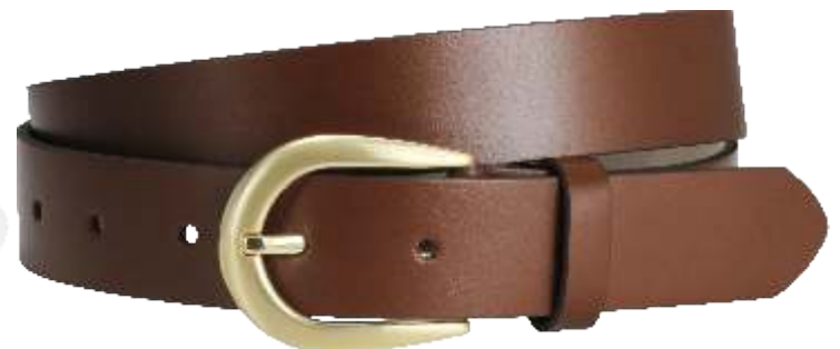
22 cognac / cognac