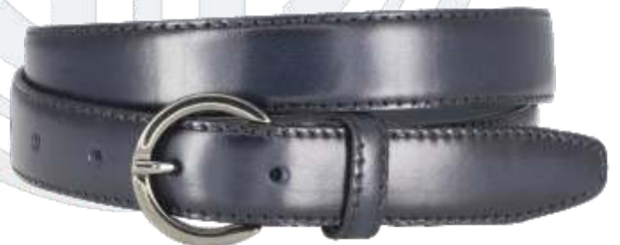
40 marine / navy