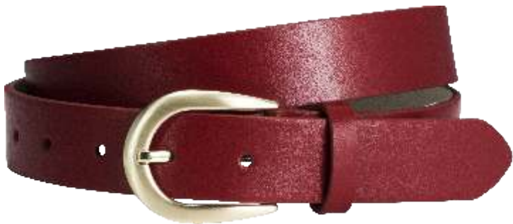
30 rot / red