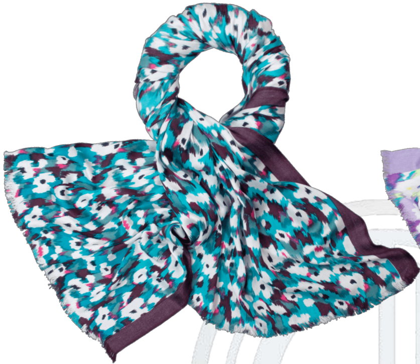
6402520/01 P134 75 cm x 200 cm, 100% Viskose/viscose