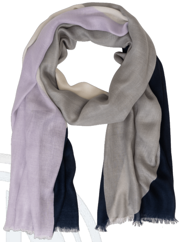
6402518/03 P134 75 cm x 200 cm, 100% Viskose/viscose