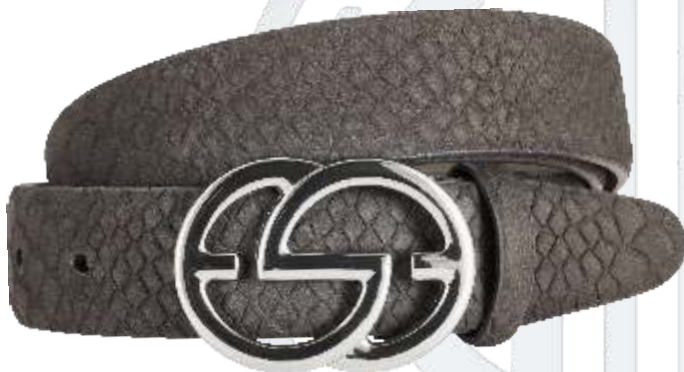
11 anthrazit / anthracite