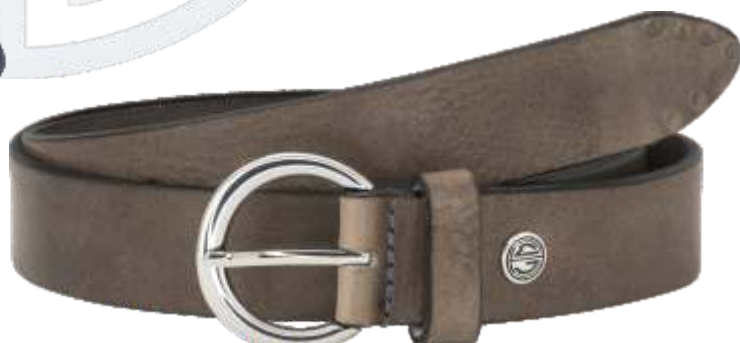
50 grau / grey