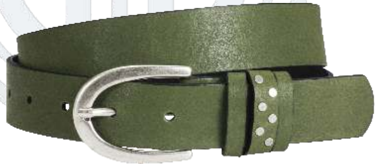
60 grün / green