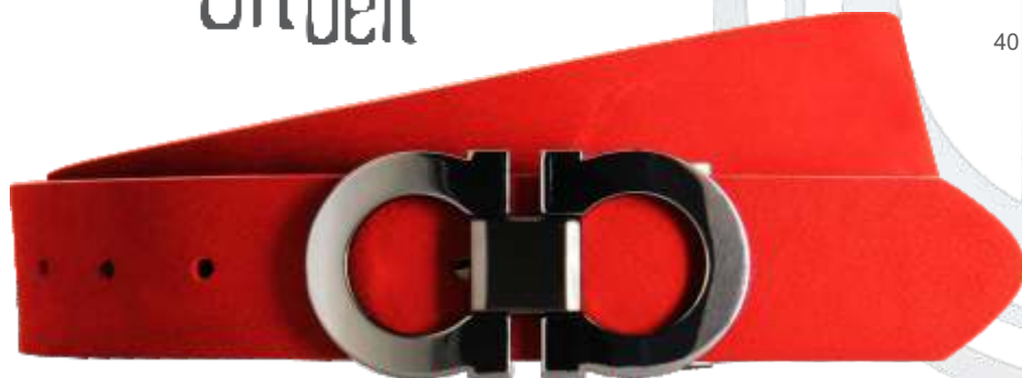
30 rot / red