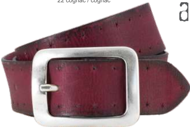
30 rot / red