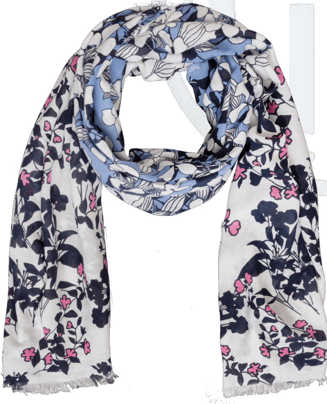
6402513/01 P134 100 cm x 200 cm, 100% Baumwolle/cotton